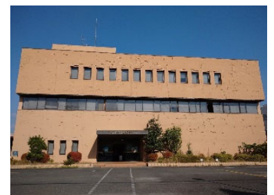
<埋蔵文化財センター>

施設の老朽化に伴い、大規模改修工事(令和10年度完了予定)を実施し、施設や設備の長寿命化を図ることで、出土品などの資料のより適切な保存管理や公開を進めていく。