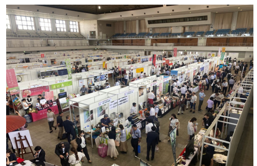
<Food EXPO Kyushu2023 >

福岡・九州の食の魅力を世界に発信するとともに、海外販路拡大を図るため、「国内外食品商談会」を開催する。