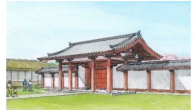
<鴻臚館整備イメージ>

歴史文化の発信、観光・MICEの拠点としての活用を目指し、鴻臚館東門や塀の一部の復元に向けた実施設計等を実施する。