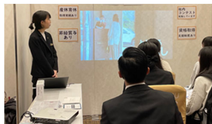
〈就職合同説明会の様子〉

観光関連事業者のデジタル化支援のほか、宿泊業界の課題である人材確保に対応するため、即戦力確保に向けた合同説明会や、大学での就職説明会の実施等に取り組む。