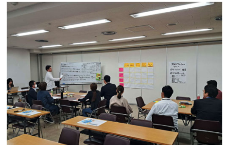
<商店街を担う人材の勉強会>

地域経済の活性化に向けた消費喚起と物価高騰対策として、商店街プレミアム付商品券の発行を支援する。