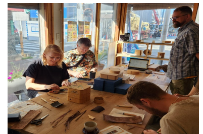
＜ワークショップ体験の様子＞

観光消費額の拡大を図るため、食、歴史、伝統文化に関する特別なワークショップなど、通常は体験できない旅行商品の開発や高付加価値旅行のプロモーション等を行う。