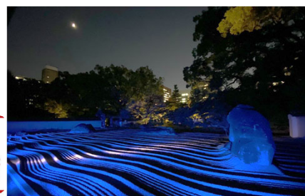
〈博多旧市街フェスティバル〉