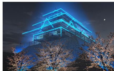
〈福岡城ライトアップイメージ〉

福岡城への観光集客向上を図るため、幻の天守閣ライトアップや夜間の来訪者を誘導する園路照明等を実施する。