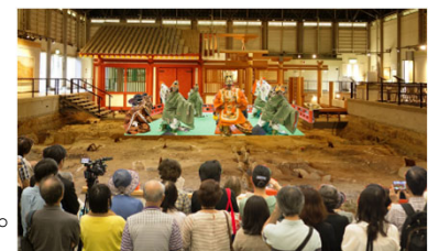
<鴻臚館展示館でのイベントイメージ>