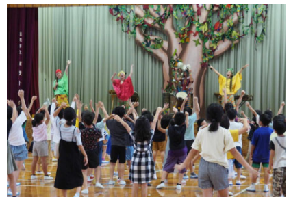
< 子ども向け事業「アーティストとであう」 >

小学校に伝統文化、音楽等のアーティストを派遣するなど、子どもたちが質の高い文化芸術を体験・鑑賞できる機会を創出する。