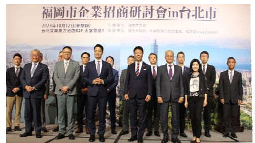
<海外での企業誘致プロモーション>

福岡市への進出を検討している外資系金融機関等を対象に、拠点設立のサポートをワンストップで行う相談窓口の運営や、地元企業と海外投資家のマッチング事業等を実施する。