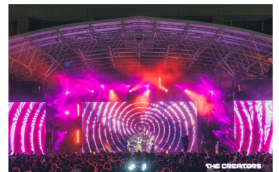
<The Creators(クリエイティブ・フェスタ)>

クリエイティブ・フェスタ「The Creators」の開催等、国内外に向けたブランド化を図るとともに、クリエイティブ関連産業の集積を目指す。