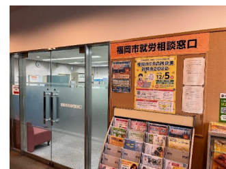
〈就労相談窓口(博多区)〉