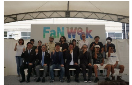
< FaN Week オープニング >