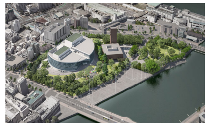
< 拠点文化施設、須崎公園整備イメージ >

施設と公園の一体整備により、みどり溢れる文化芸術空間を創出し、多くの人々が集うエリアの形成に向け、施設整備、開業準備、運営等を行う。