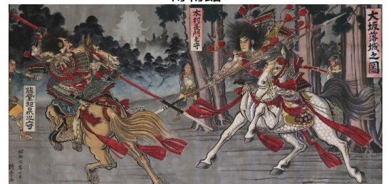
<大灯籠絵(大坂落城之図)/宮崎宮所蔵>