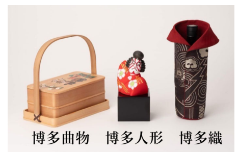
博多曲物 博多人形 博多織

小学生のものづくり体験や、ホームページを活用した若者へのものづくりの魅力発信などにより、技能職の認知度と地位の向上を図り、後継者の育成につなげる。