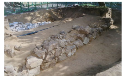
<箱崎地区元寇防塁>

九州大学箱崎キャンパス跡地の元寇防塁がもつ歴史的ストーリーを伝えながら、誰もが歴史に触れ、憩うことができる整備案について検討を実施する。