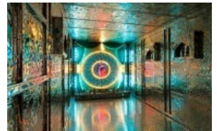
<ドゥリヤ・カジ他《ハート・マハル》1996年>