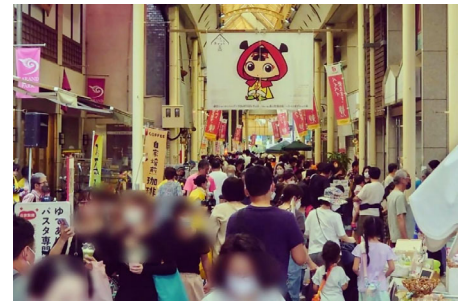
<来街者で賑わう商店街>

商店街の継続的な賑わい創出に向け、個々の商店街の特性と課題に応じた、魅力向上につながる取組みを支援する。