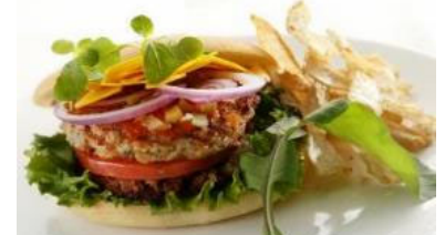
＜ヴィーガンに対応した食＞

訪日外国人の多様な食文化に対応するため、飲食店向けメニューの開発支援によりヴィーガン対応店舗等の拡充に取り組むとともに、情報発信を行い、誘客を図る。