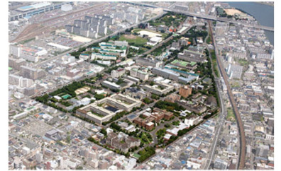
<九州大学箱崎キャンパス跡地>

九州大学箱崎キャンパス跡地において、水素供給パイプラインを整備するとともに、水素ステーションの整備に向けた検討等を実施する。