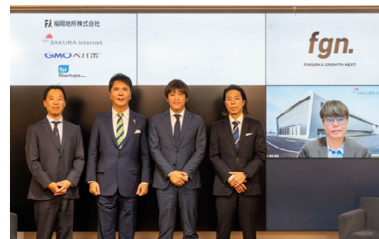
＜スタートアップ支援施設 Fukuoka Growth Next 新運営体制発表会見＞

スタートアップ企業の更なる成長や既存中小企業の第二創業を促進するため、スタートアップ支援施設「Fukuoka Growth Next」とスタートアップカフェの運営を一体化し、創業から成長まで一貫通貫で支援する。