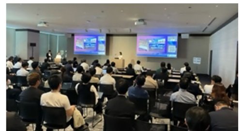
<ピッチイベントの様子>