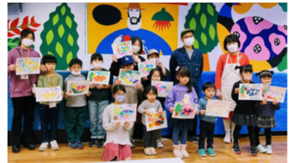
< Artist Cafe Fukuoka 企業や地域とのマッチング例 >