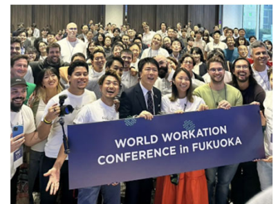
＜ワールドワーケーションカンファレンス開催の様子＞