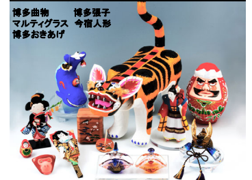
<福岡・博多の伝統工芸品>