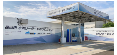
<水素ステーション>

利用者の利便性向上を図るため、営業日数を週4日から週6日に拡大する等、水素普及に関する取組みを実施する。