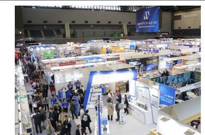
＜マリンメッセA館・B館を同時利用した大型展示会の様子＞

都市のプレゼンス向上につながる国際会議やビジネス機会の創出につながる展示会など、質の高いMICEの誘致強化に向けた助成金等の支援内容の充実に取り組む。