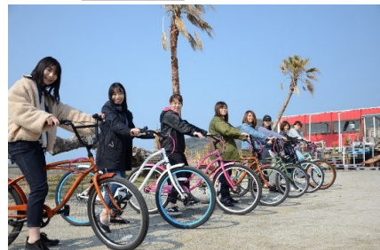
〈サイクリングによる周遊イメージ〉