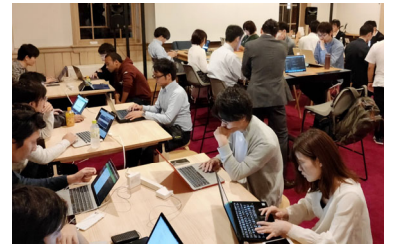
<エンジニアカフェ(赤煉瓦文化館)>

エンジニアカフェにおいて、先端技術やビジネス等の知見に長けたスタッフを配置し、サービス設計等を支援するとともに、エンジニアの育成・発掘につながるイベント等を実施し、新サービス・新製品の創出を促進する。