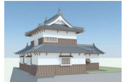
<潮見櫓復元イメージ>

歴史的景観の創出によりさらなる集客・魅力向上を図るため、潮見櫓の建物復元工事(令和6年度末竣工予定)等を実施する。