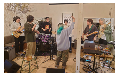
<タイと福岡のアーティストによる 共同楽曲制作>

福岡音楽都市協議会と連携し、ビジネスの活性化に向けた取組みや、音楽関連情報の一元的な情報発信、人材育成事業を実施する。